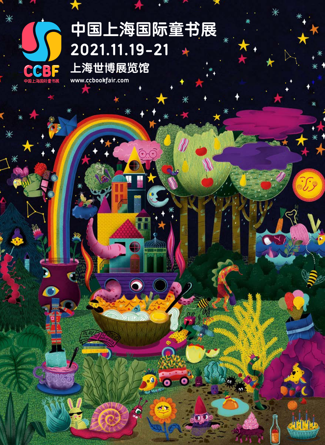
2020年CCBF金风车国际青年插画家大赛特别提名奖获得者弗朗西斯科·朱斯托齐先生提供插画